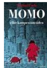
Läsecirkeln läste boken