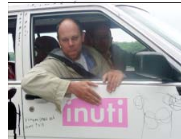
Buster i bilen som åkte till Gotland.

Utställning på Busters Mack på Gotland Mellan 1 till 6 augusti ställde 3 konstnärer ut på Busters Mack i Burgsvik på Gotland.