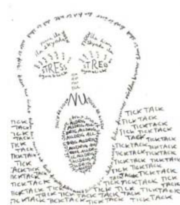
Tidsskriet Agneta tecknade