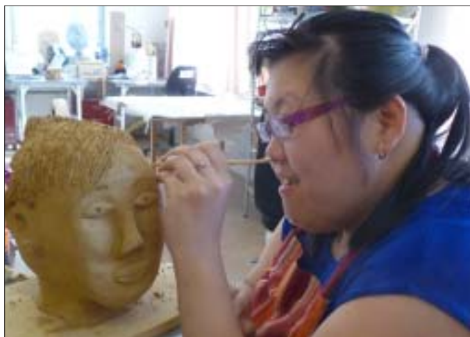
Chang Im och Chang Im - i Terracotta och Live